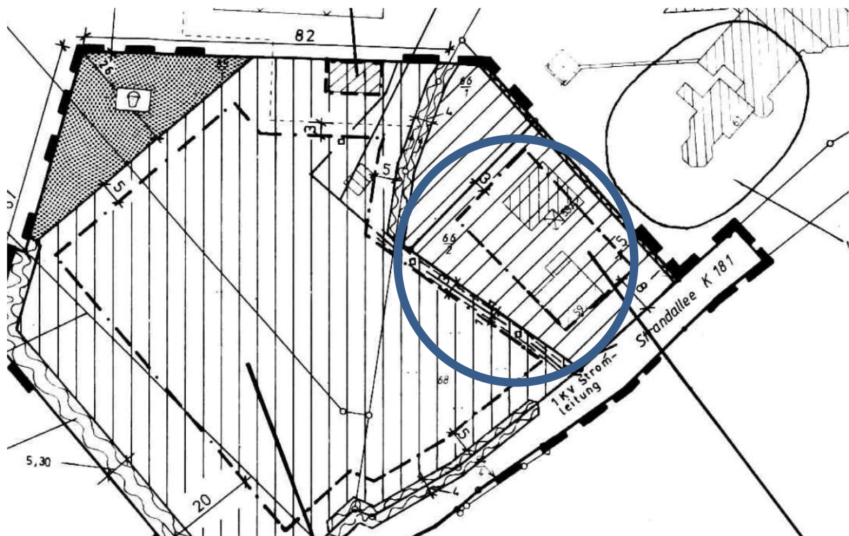
Abbildung 3: Ausschnitt aus der 2. Änderung des Bebauungsplans Nr. 10

Textlich wurde festgesetzt, dass Garagen und Nebenanlagen innerhalb der nicht überbaubaren Grundstücksflächen parallel zur öffentlichen Verkehrsfläche nicht zulässig sind.