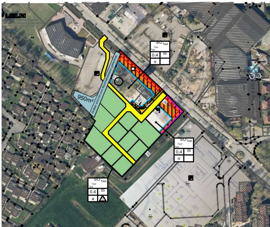
Abbildung 3: Städtebauliches Konzept für das Plangebiet

Unter Umsetzung des beschriebenen Baukonzepts und unter Berücksichtigung des Bedarfes an Ferienwohnungen und Dauerwohnnutzungen in dem Ortsteil Tossens, stellt die Gemeinde Butjadingen den Bebauungsplan Nr. 189 „Tossens, Erweiterung Villa Küstenwind“ auf.